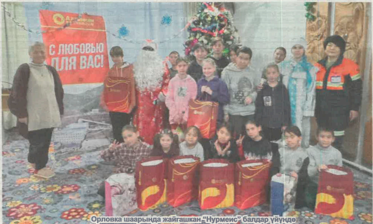
Орловка шаарында жайгашкан «Нурмеис» балдар үйүндө