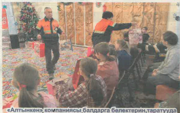
«Алтынкен» компаниясы балдарга белектерин таратууда