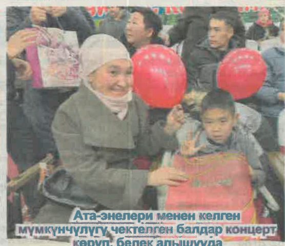
Ата-энелери менен келген мүмкүнчүлүгү чектелген балдар концерт көрүп, белек алышууда