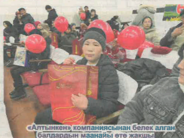
«Алтынкен» компаниясынан белек алган балдардын маанайы өтө жакшы